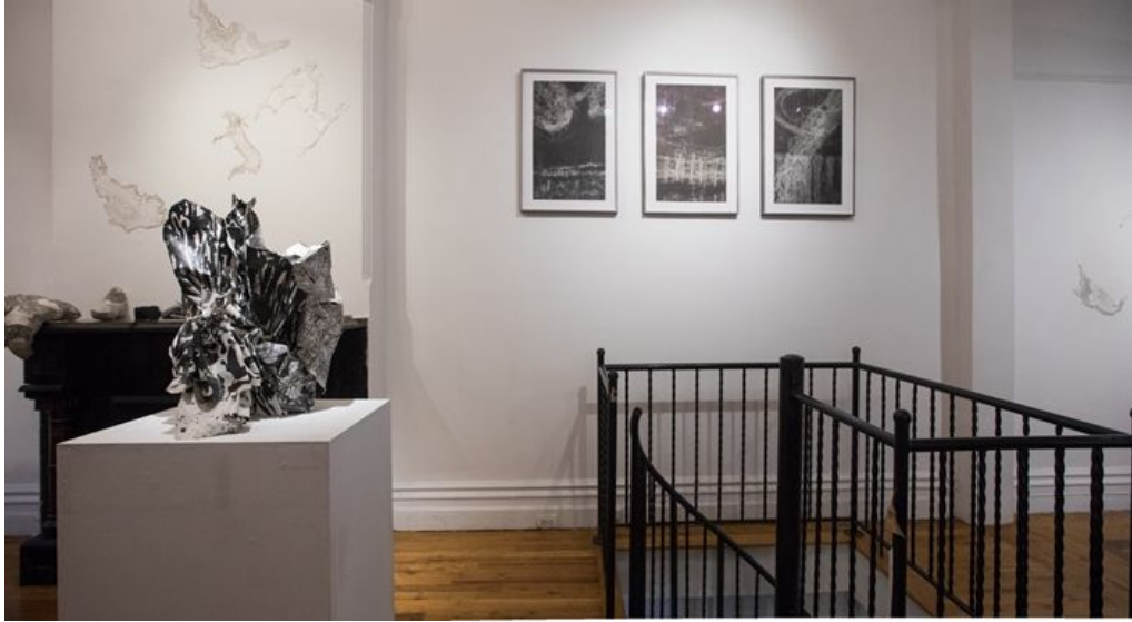
《金智淑与沈禾美：造山》展览现场

山脉没有人造痕迹，证明了自然的伟大。自然地理分界和人类所决定的分界是对地球上生命 的不同诠释。人类时间和地质时间并无交集。尽管这些山脉的地理位置并不会改变，但是它们还 是在不断变化。因此，它们的形象集合了来自于久远的过去的记忆以及当下的变迁。