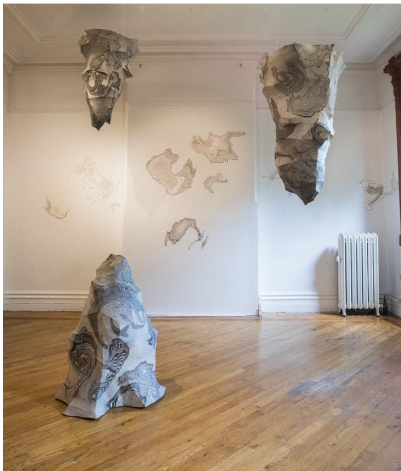
《金智淑与沈禾美：造山》展览现场