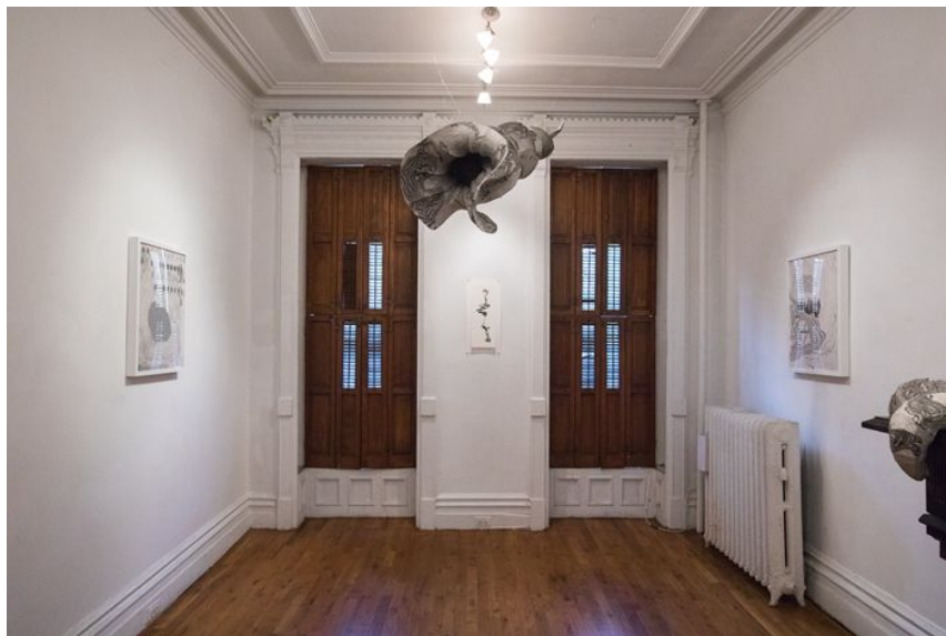
《金智淑与沈禾美：造山》展览现场