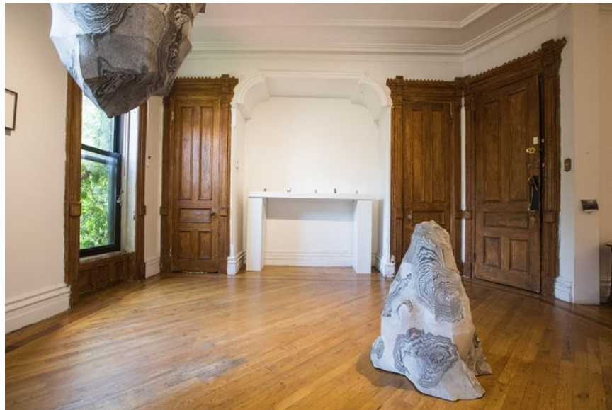
《金智淑与沈禾美：造山》展览现场，摄影:林沛超 ©沈禾美与金智淑，致谢否画廊