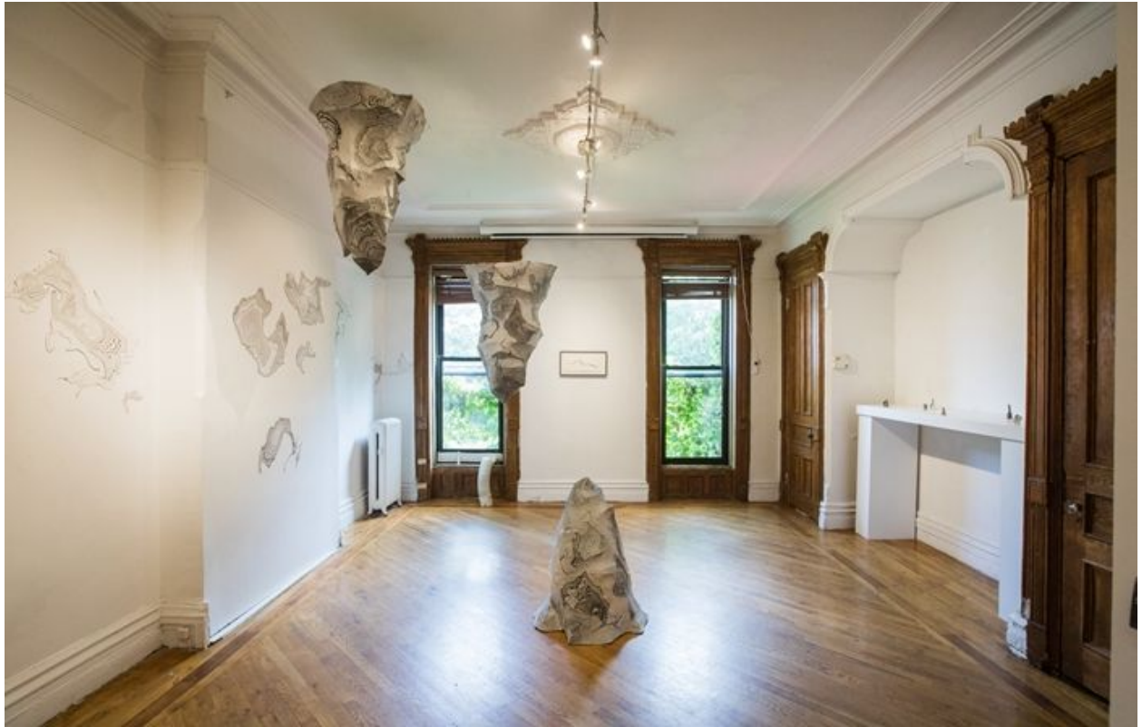
《金智淑与沈禾美：造山》展览现场，摄影:林沛超 ©沈禾美与金智淑，致谢否画廊

析自然现象，其壮观性与人类活动并无关联，却在历史的进程中不断受到人类的关注，而艺术家们更是通过不同的途径与自己独特的视觉语言相结合，将其以艺术的形式呈现出来。