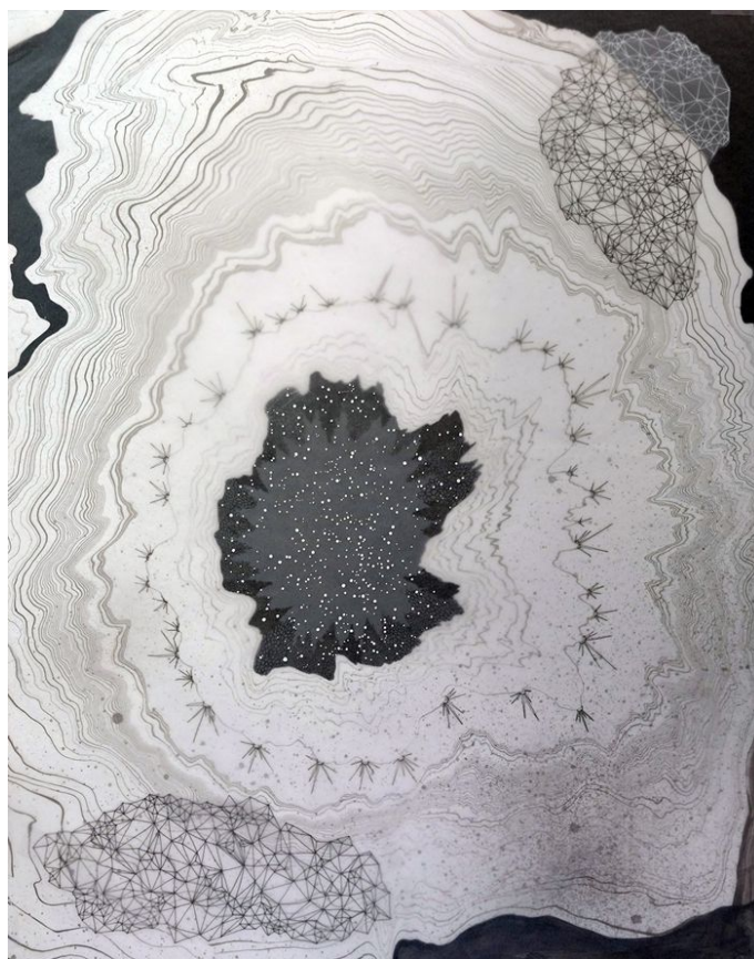
金智淑，情绪记忆，2017.墨,纸上铅笔和丙烯, 19 x 24 inches ©金智淑,致谢否画廊

韩国艺术家金智淑，自幼学习传统雕塑。在她的简化抽象模型中，自然的能量通过一种人造而有机形式表现出来，隐喻一种似是而非，模棱两可的存在状态，这种状态模糊了现实与想象、人类生命与宇宙之间的界限。沈禾美的雕塑融入了对中国文人石的偏爱，集中呈现了人类在环境中留下的深刻印迹。