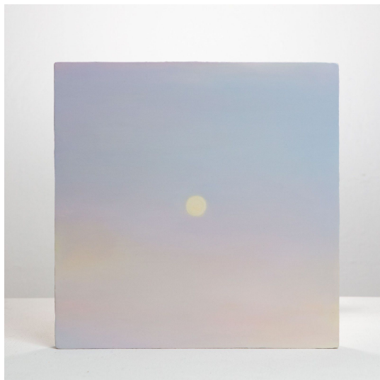
郭淑玲, <5-6 pm>-13, 2020. 木板油画, 30.5 x 30.5 cm. 摄影：云开 ©郭淑玲, 致谢否画廊