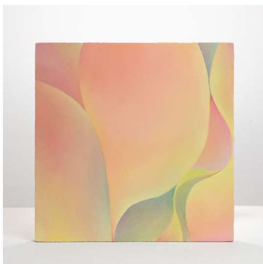
郭淑玲, <皮肤>-5, 2020. 木板油画, 30.5 x 30.5 cm. 摄影：云开 ©郭淑玲, 致谢否画廊