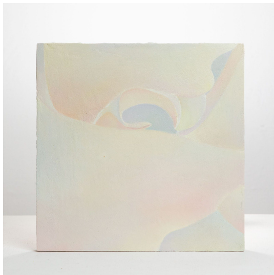
郭淑玲, <皮肤>-1, 2020. 木板油画, 30.5 x 30.5 cm.